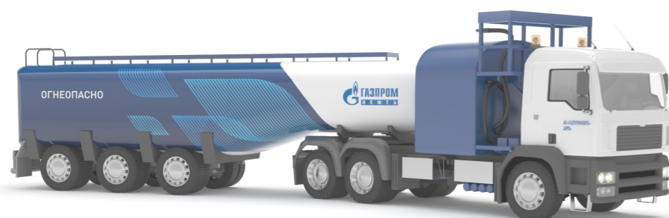
Топливозаправщик для всех видов воздушных судов