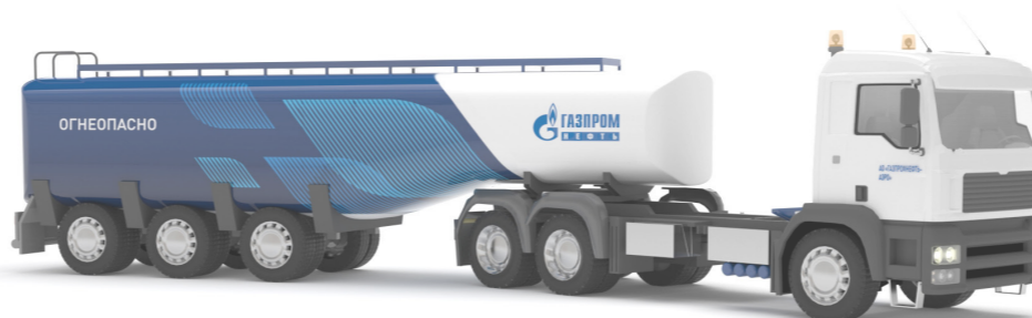
Транспортное средство для перевозки топлива по дорогам общего пользования